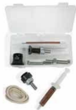
Polish kit para rodillos 9901000016