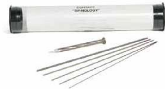
Tipnology Kit 9901000017

El kit "Tipnology" (figura inferior izquierda) es una herramienta para limpiar y sanear las puntas de contacto de las proyecciones y ejes cortantes evitando el afeitado del hilo y el pegado del mismo a la punta. El kit "Polish" (figura inferior derecha) es un conjunto de herramientas para restaurar la superficie de los rodillos de alimentación, los cuales se degradan por los restos superficiales de hilo durante la alimentación y posterior contaminación del conducto hasta la punta de contacto. Muchas veces no pueden apreciarse a simple vista, por lo cual el kit se compone de unas gafas de aumento, herramientas de resanado, una pasta con diamante y una cuerda para pulir y recuperar la superficie de los rodillos. They may not be visible to the naked eye, but yet present on the surface of the wire drive rolls.