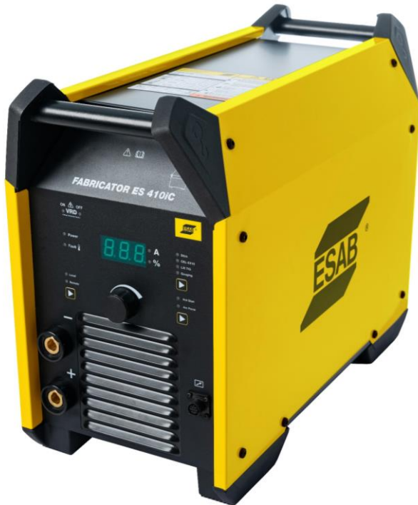
Fabricator ES 410iC