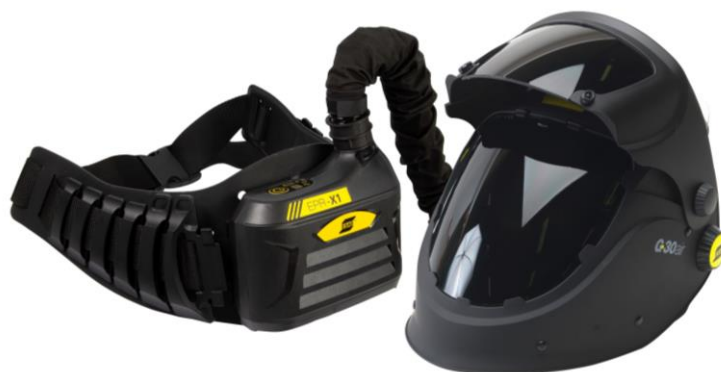
G30 Air con PAPR de ESAB