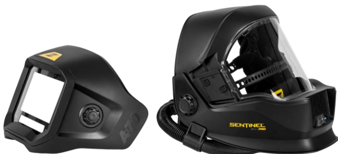
Sentinel A70 Air PRO con ADF extraíble

Visite esab.com para obtener más información.