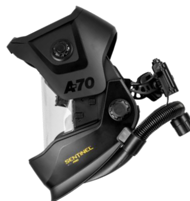
Sentinel A70 Air PRO