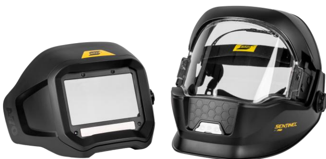
Sentinel A70 Pro con ADF extraíble

Visite esab.com para obtener más información.