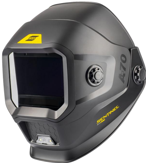
Sentinel A70 Pro