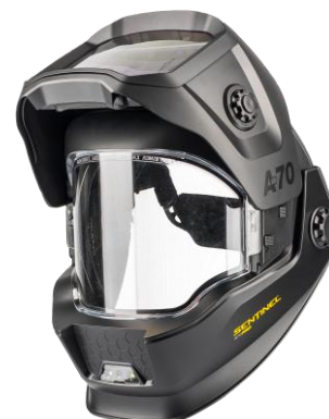
Sentinel A70 Pro